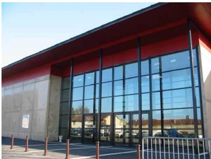
Le hall d'accueil du Carré :