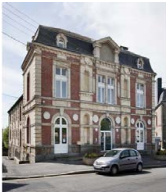
La salle de spectacle :