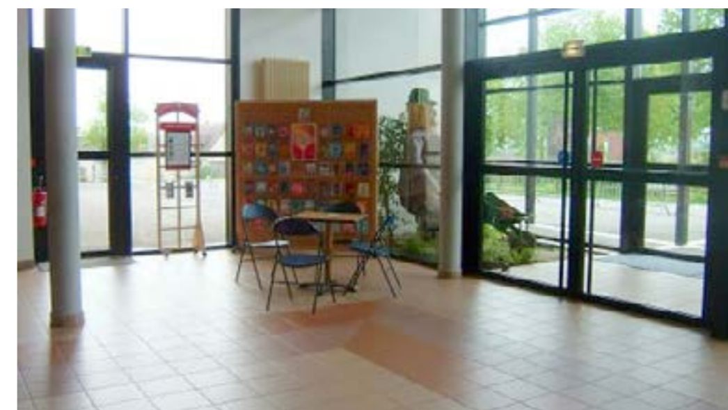
Le hall d'accueil du Carré :