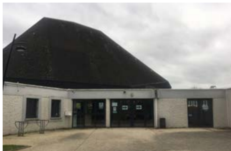
Le hall d'entrée du Théâtre : ↓