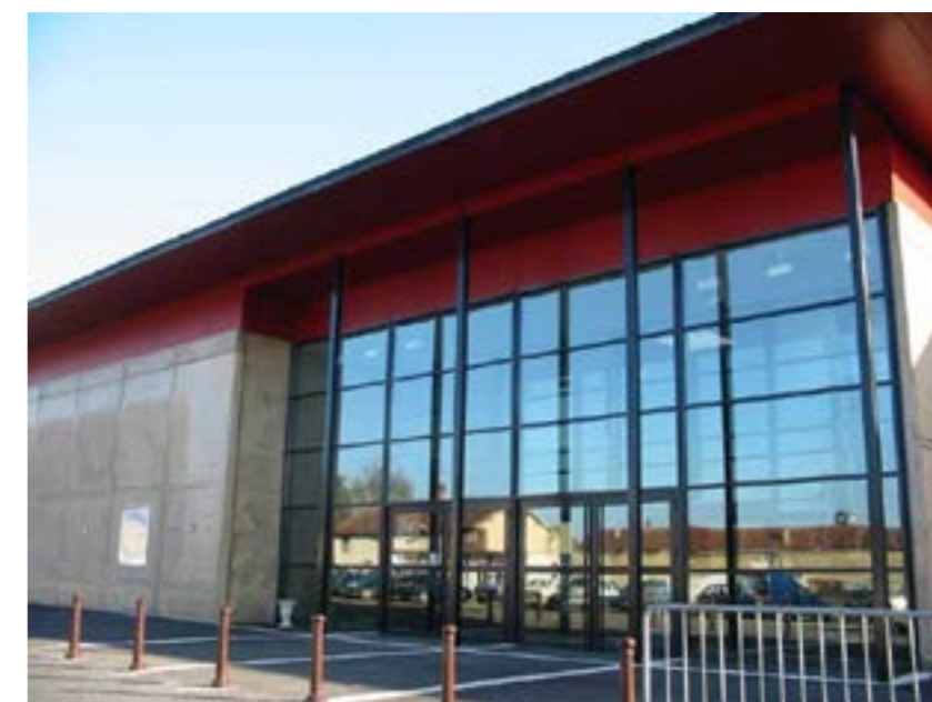
Le hall d'accueil du Carré :