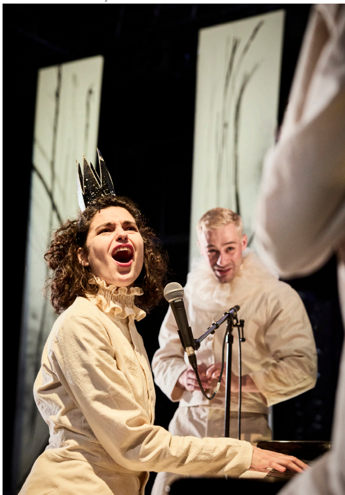
Le Roi, la Reine et le Bouffon