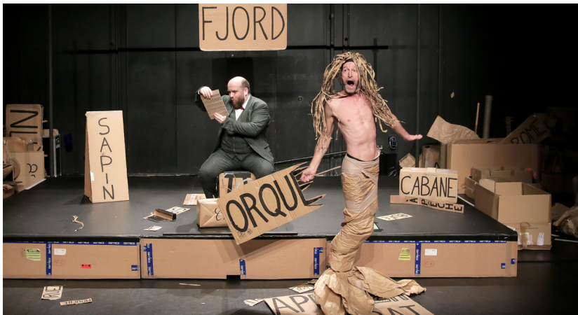
Les gros patinent bien - © Fabienne Rappeneau