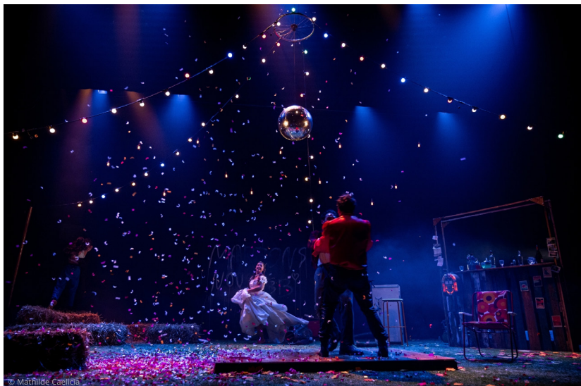
Le jeu de l'amour et du hasard - © MCAELICIA