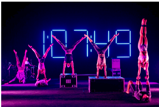
Ten Thousand Hours - © Darcy Grant